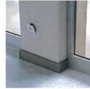
Daily #01, 2008

Taking as reference the images published in the media, Thomas Demand reconstructs life-size models of scenes depicting a key cultural or political event, like the first press conference of president-elect Donald Trump or the Fukushima control room.