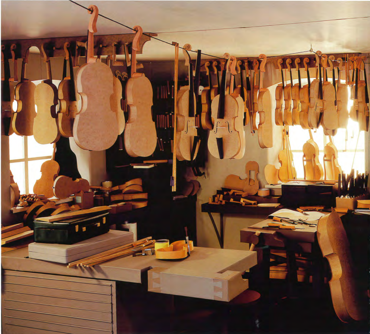
Werkstatt / Workshop, 2017