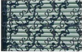
Daily #19, 2012

Las composiciones del artista alemán aparecen siempre desprovistas de figuras humanas, una ausencia destinada a provocar cierta inquietud en el espectador, al que invita a utilizar su imaginación y participar activamente de su 'teatro de la emoción'.