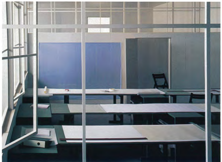
Drafting Room, 1996